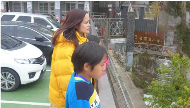
每日望遠凝視 10 分鐘