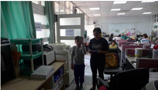
每學期定期視力檢查