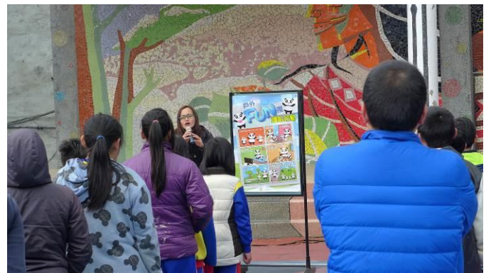
視力保健行事課宣導