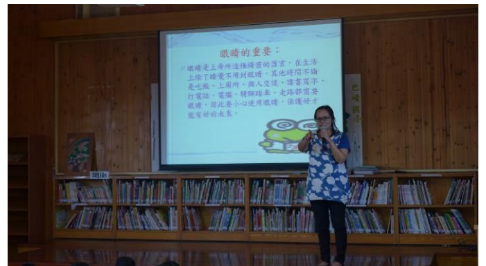
行事課－視力衛教宣導