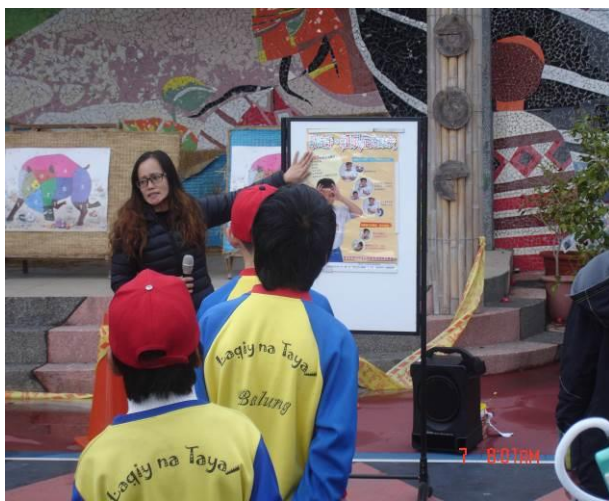
勤洗手紅眼症遠離我