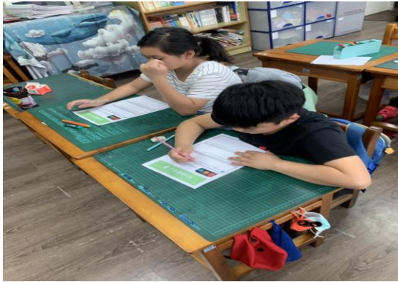
說明：五年級學生撰寫交通安全學習單