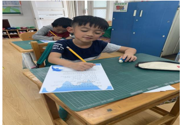
說明：三年級學生撰寫交通安全學習單