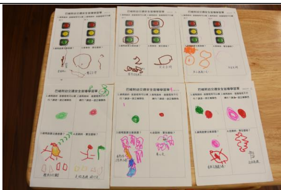
說明：幼兒園交通安全學習單