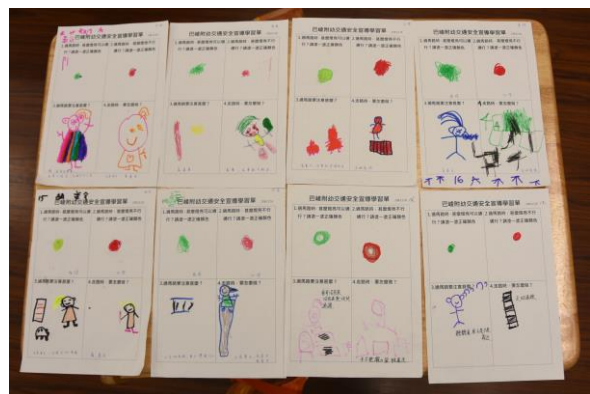
說明：幼兒園交通安全學習單