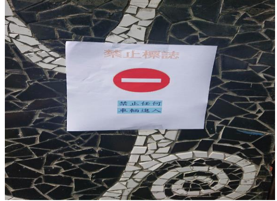
說明：認識交通標誌