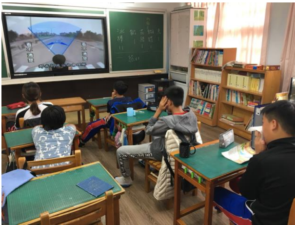
說明：交通安全教學媒體使用