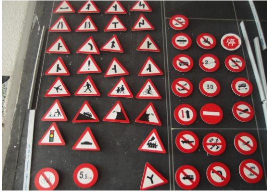
說明：交通號誌佈告欄