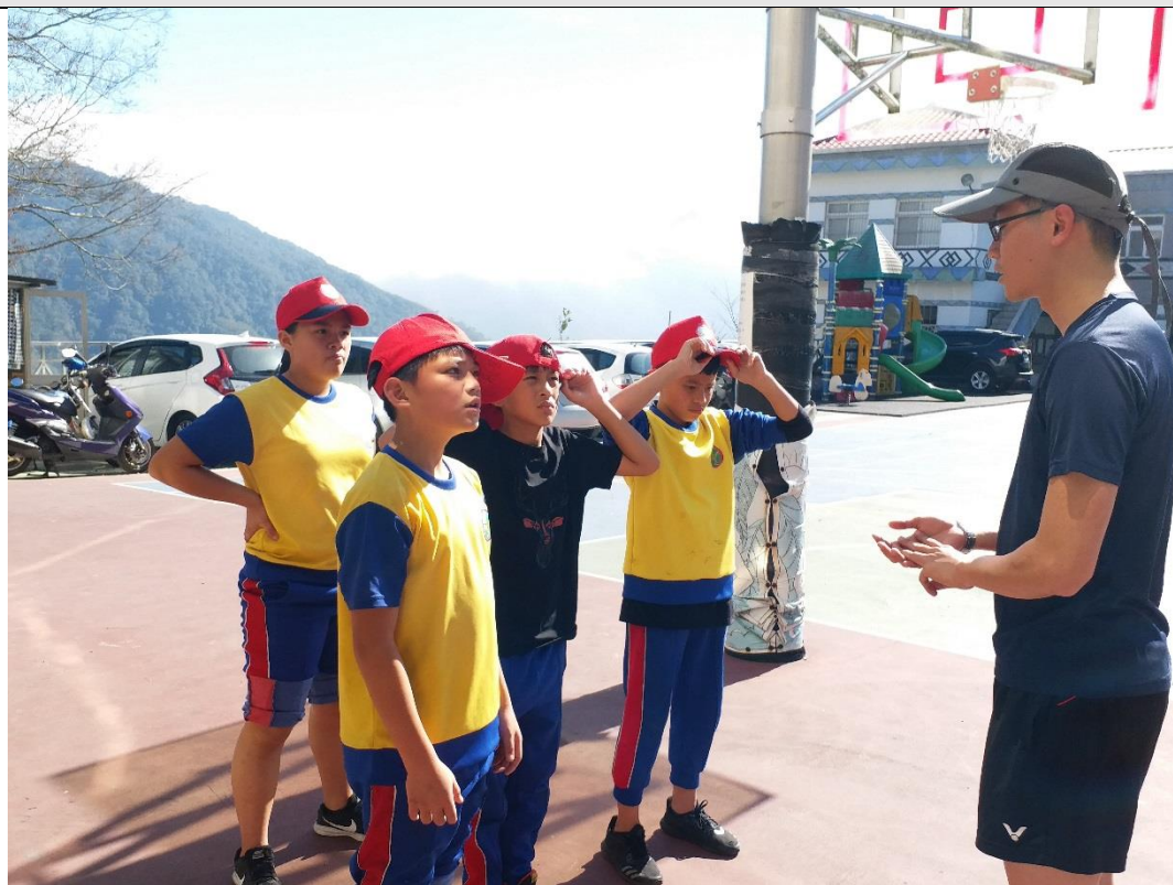
從旁指導學生在校內訓練田徑