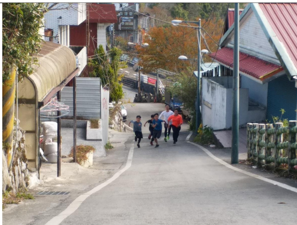
從旁指導學生在校外訓練田徑